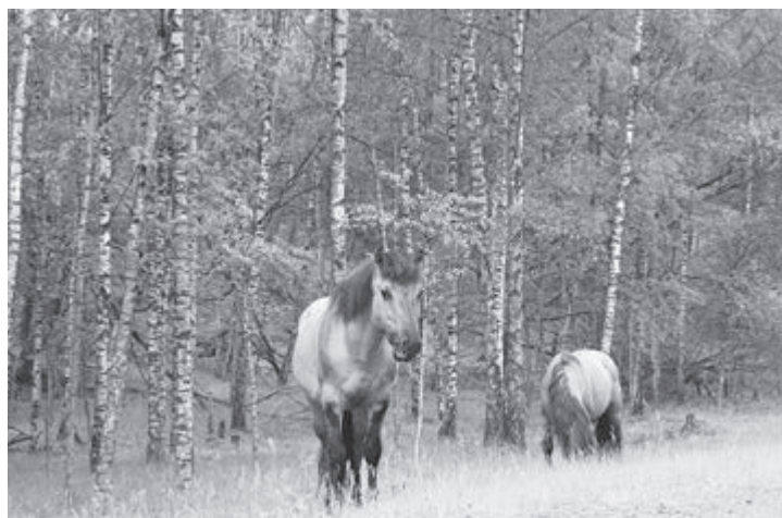
Het Limburgs Landschap organiseert op 1 en 9 juni een excursie in Groeve 't Rooth.