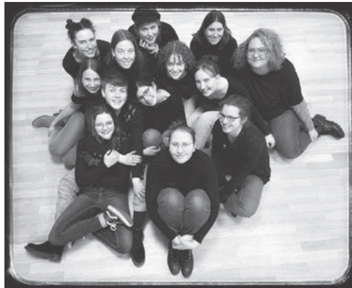
Entree: € 15,00 | Tickets bij tickets@frameless-chor.de www.dekopermolenvaals.nl Tel: +31 433064668