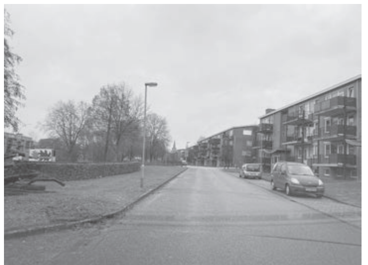
Brandstraat / Igen Bende, Simpelveld