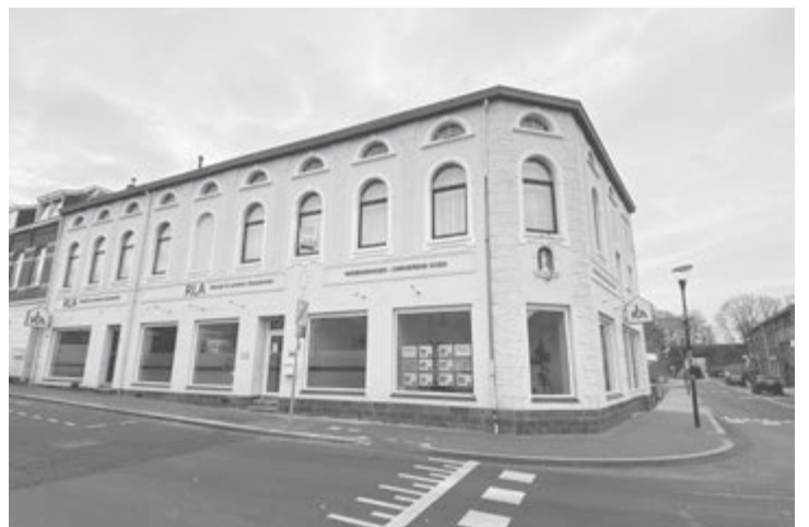
Voormalige winkel Schobbers, Bocholtz