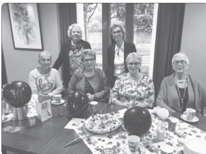
Onze teken- en schildergroep uit Simpelveld van de SWOBS vierde afgelopen dinsdag 12 oktober haar 40 jarig bestaan.